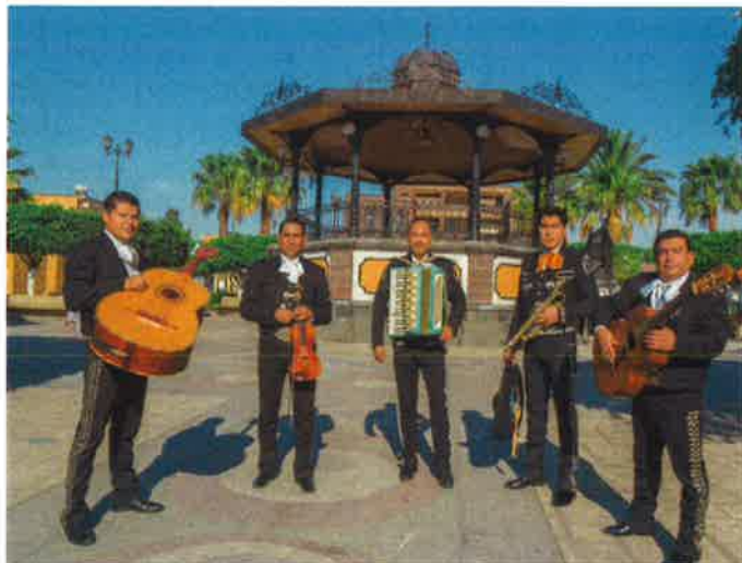
マリアッチ・コラレホ

マリアッチ・コラレホ メキシコと日本それぞれ に活動拠点を持つ実力派 ミュージシャンによる特 別編成ユニット。メキシ コ大使館や氷川きよしま さんのコンサートなどにも 正統派メキシコ音楽の代 表として参加。