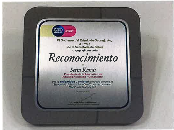
引渡式においてグアナファト州政府より贈られた楯