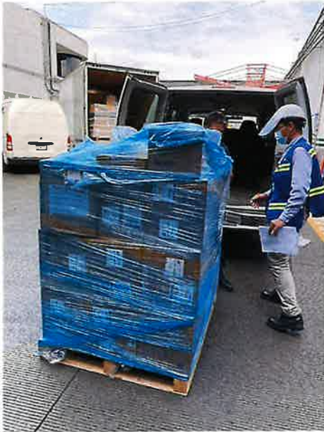
空港に到着した医療物資