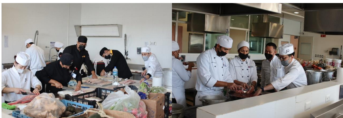
Gracias a la combinación de chefs de Hiroshima y Guanajuato, se proporcionó una excelente comida