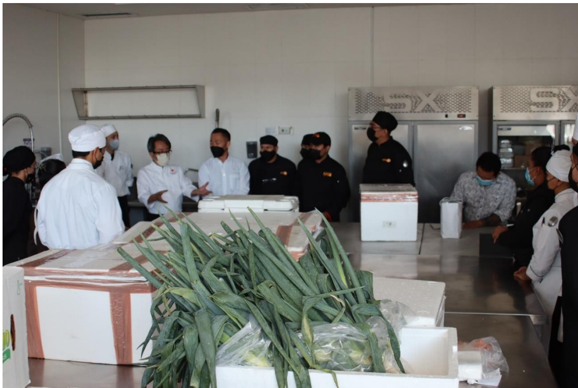
Reunión en la cocina de la Universidad La Salle antes de comenzar la preparación

Por otra parte, el Grupo FYNSO, representada por el Sr. Felipe, que cuenta con numerosos restaurantes japoneses y otros en México, prestaron todo su apoyo con su cocina central, los chefs y personal de cada restaurante. Además, para la preparación de la comida se prestó la cocina de la Facultad de Gastronomía de la Universidad La Salle de León, y seis estudiantes seleccionados de la universidad participaron como practicantes. También, una vez más, la Sociedad de Hiroshima Guanajuato Amigo-kai y la MMVO (Planta de Mazda en México) nos brindaron su ayuda con transporte en vehículo e intérpretes, lo que nos permitió estar bien preparados para el evento.